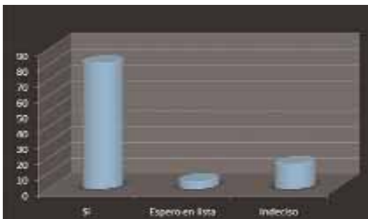
¿Aceptaría un riñón de donante vivo?