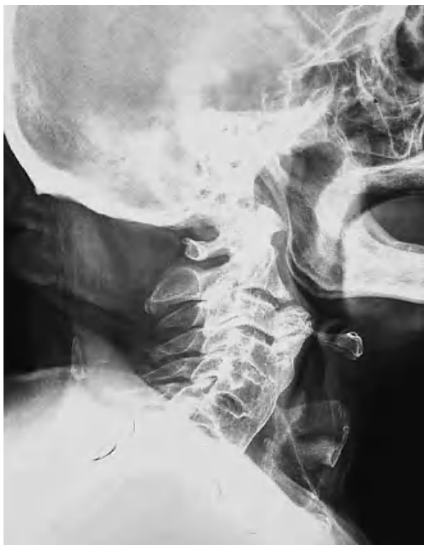
Figura 1. Radiografía lateral de cuello. Se aprecia hiperostosis marcada que casi contacta con la epiglotis a nivel C3-C4-C5.

Se realiza tomografía axial computarizada (TAC) de cuello (fig. 2) donde se aprecia intensa osificación con neoformación ósea del ligamento vertebral anterior que proyecta hacia la cavidad faringoesofágica compatible con enfermedad de Forestier, que se completa con estudio de otras articulaciones por el Servicio de Reumatología.