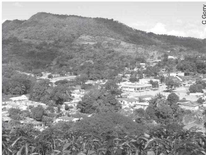
Cruce de los Baños, 2011