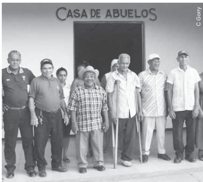
Adultos mayores en la Casa de Abuelos, Cruce de los Baños

“Se logran mejorías en la salud al acercar la atención a aquellos que la necesitan: nuestros médicos a menudo van al terreno a