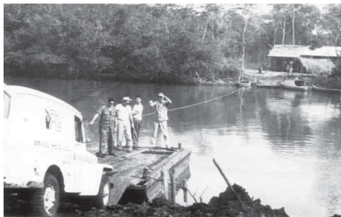
Los del Servicio Médico Rural enfrentaban retos formidables (foto c. 1960)

Es notorio en el mundo entero lo extremadamente difícil que es encontrar personal dispuesto a trabajar en zonas remotas—y el cuadro en Cuba se vio complicado por la emigración entre 1959 y 1963 de casi la mitad del total de 6300 médicos con que contaba el país.[9] Cuando la Universidad de La Habana reabrió sus