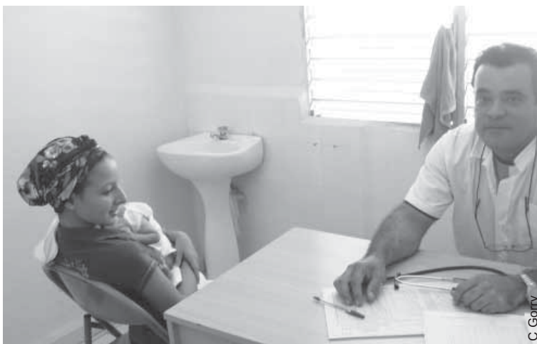
Madre e hijo en una visita al pediatra, Policlínico Cruce de los Baños