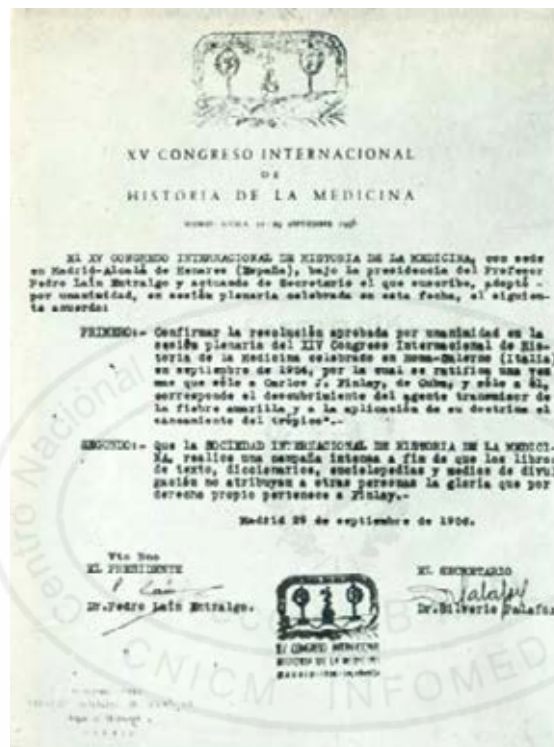
Facsímil del acuerdo del XV Congreso Internacional de Historia de la Medicina celebrado en Madrid-Alcalá de Henares en 1956.