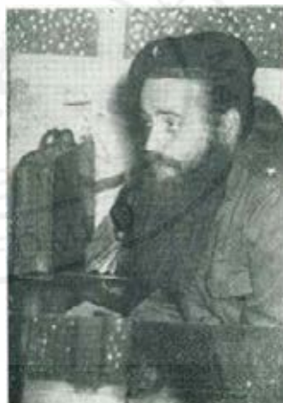
COMANDANTE MANUEL PIÑEIRO

. . . alumno de la Escuela de Medicina y Presidente de la Asociación de Estudiantes de Medicina de la Universidad de la Habana, que actuó en la Sierra como combatiente alcanzando el grado de Capitán.