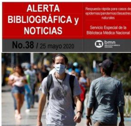
Transmisión asintomática y presintomática del SARS-Cov2