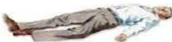
Pérdida del conocimiento, coma, muerte