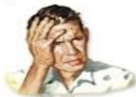
Cefalea, confusión, vómitos