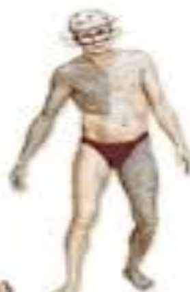
Inestabilidad Alteración para hablar Alteración de la vista