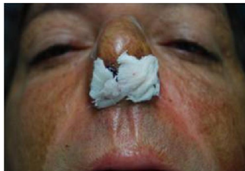
Fig. 6 Colocación de gasa con medicamentos.

Al terminar la cirugía se le colocó gasa con medicamento en los orificios remodelados (Figura 6) hasta que se retiró la sutura una semana después, colocándole el conformador nasal (Figura 7) de polimetacrilato de metilo transparente construido con anterioridad; de varios tamaños para elegir el adecuado, y posteriormente cambiarlo de acuerdo a los cambios producidos.