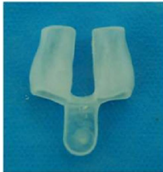
Fig. 3 Conformador nasal de metacrilato de metilo.

Existe diversidad de materiales que se utilizan para su confección, en la literatura se puede encontrar entre otros, de silicona y polimetacrilato de metilo, siendo este último el más utilizado en nuestro servicio, por su rigidez y fácil modificación. (Figura.3)