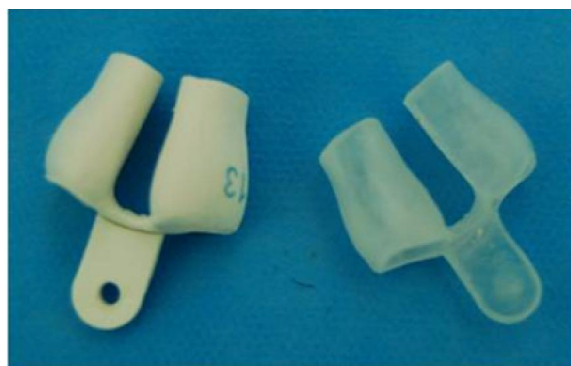
Fig. 2 Conformadores nasales: Silicona y metacrilato de metilo.

Los conformadores nasales son aditamentos de carácter ortopédico, que se colocan a través de las narinas para evitar su colapso. En ocasiones sirven de sostén a los tejidos, sustituyendo así la ausencia de cartílago o hueso. De ahí que sus formas puedan variar en dependencia de la función que van a desempeñar. 8 (Figura.2)