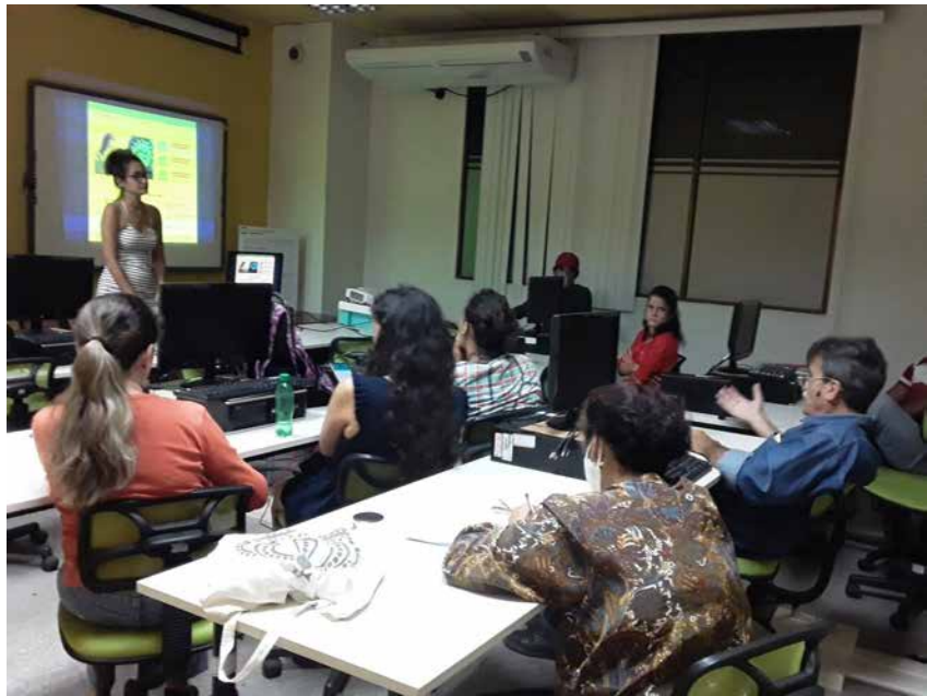
Foto: Jueves de Infomed, 20 octubre 2022. Se presenta el proyecto "Nuevo Portal Infomed"

En el año 2007 se realiza el primer Jueves de Infomed, con la idea de realizar sesiones de trabajo de tipo técnico y profesional orientados a desarrollar el aprendizaje organizacional y discutir proyectos clave para el desarrollo de Infomed.