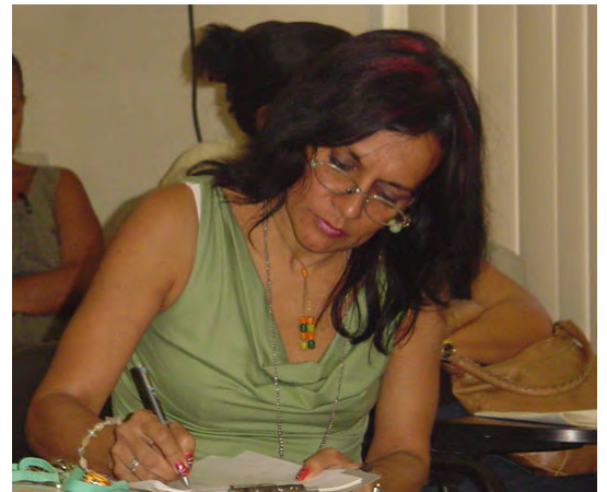
Olema en un curso de Mapas Conceptuales en INFOMED

Han pasado por diferentes etapas, pero considero que hoy la tecnología ya es dominada por niños y jóvenes, que existen profesionales de la salud con las competencias informacionales y digitales, entonces el reto es más grande para nosotros, quiero decir que debemos llegar a todas las aristas de nuestra especialidad ahora automatizadas con más conocimiento y habilidades para ser capaces de ofrecer servicios de mayor calidad, con precisión y prontitud.