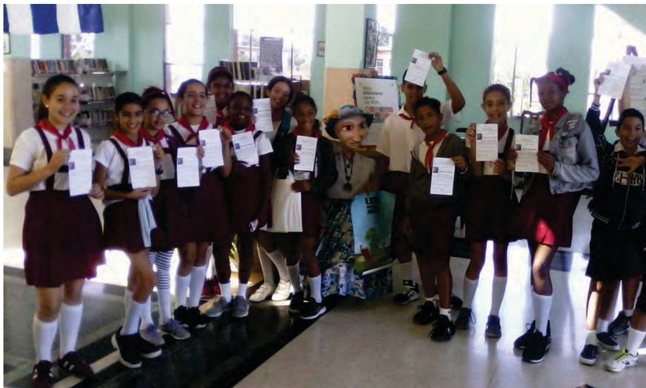
PREMIACIÓN DEL CONCURSO "DE MI CIUDAD QUIERO SABER..."

Se realizó la premiación del Concurso Municipal De mi ciudad quiero saber... en su XXIII edición, en la biblioteca pública municipal Manuel Cofiño de Arroyo Naranjo para celebrar el 500 aniversario de la Villa San Cristóbal de La Habana.