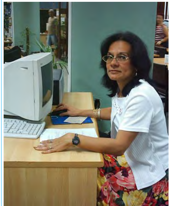
Olema en el área de los servicios de la Biblioteca Médica Nacional