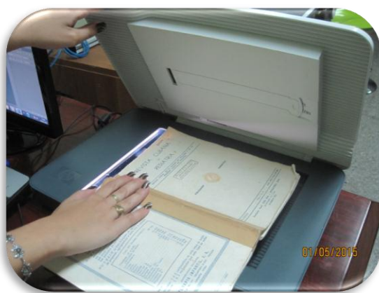
Colecciones impresas digitalizadas