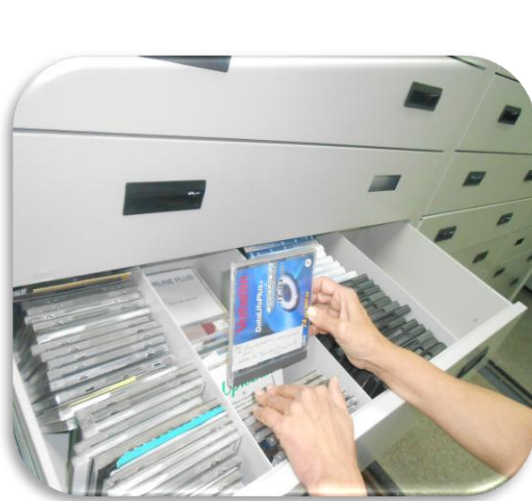
Colecciones Digitales, CD

Resultado de este trabajo, nuestros especialistas crearon un Repositorio Institucional de Documentos Digitalizados donde se recoge, se organiza y se conserva todo el producto generado por esta actividad. Es una plataforma en SWITCH que permite gestionar todos estos documentos patrimoniales en formato digital, a través de la incorporación de metadatos, que permiten el acceso a cada documento, su gestión y también su preservación. Se encuentra disponible en: http://documentosdigitalizados.sld.cu/