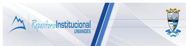
REPOSITORIO INSTITUCIONAL UNIANDES