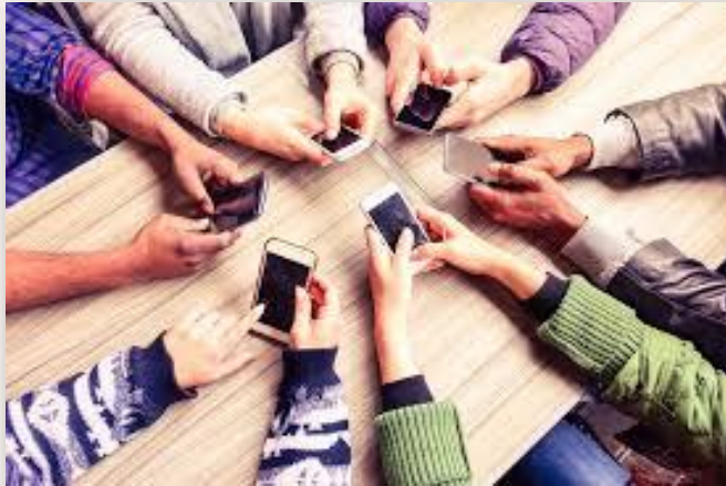
Usuario siglo XXI