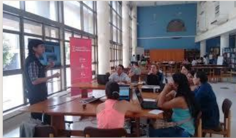
Bibliotecarios siglo XX