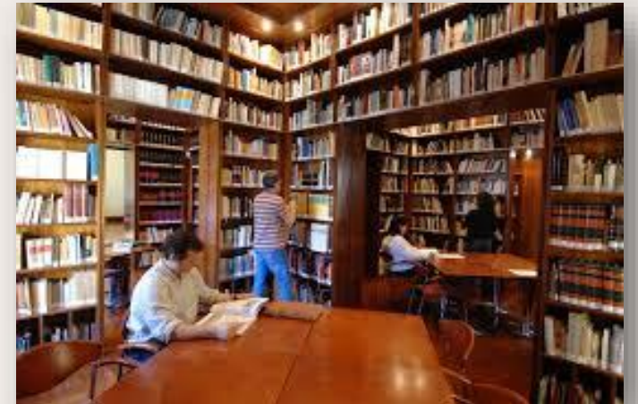
Bibliotecas Siglo XIX