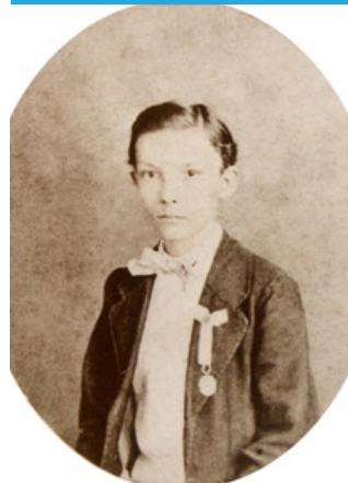
José Julián Martí y Pérez