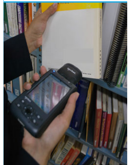
Lector de Sistemas de Identificación por Radio Frecuencia (RFID)

La capacidad de RFID para identificar unívocamente cada artículo es muy adecuado para las bibliotecas ■