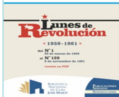
Portada CD, colección Prensa Cubana