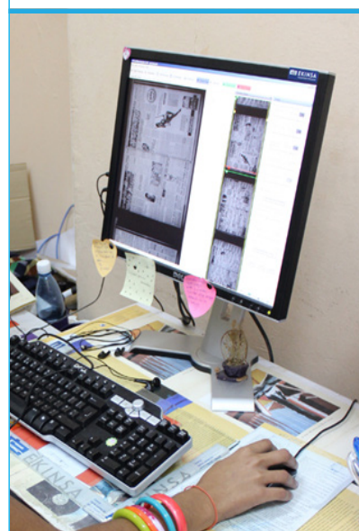
Edición de imágenes en el Laboratorio Digital de la BNCJM