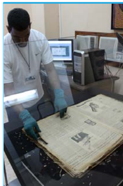
Laboratorio Digital de la BNCJM

Un trabajo de digitalización bien logrado favorece el acceso de los lectores a los documentos patrimoniales y la preservación de la información, sin dejar de tener en cuenta que la aplicación de metadatos es muy conveniente para organizar y recuperar la información ■