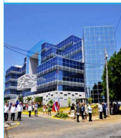
Centro Nacional Coordinador de Ensayos Clínicos (CENCEC).

La actividad contribuyó notablemente al desarrollo de una nueva estrategia en la obtención de mejores soluciones informáticas para la eficiencia del sistema de gestión de calidad ■