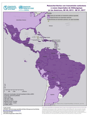
Figura 1. Chikungunya en el Caribe y la región de las Américas. Países y territorios con transmisión autóctona/importados.