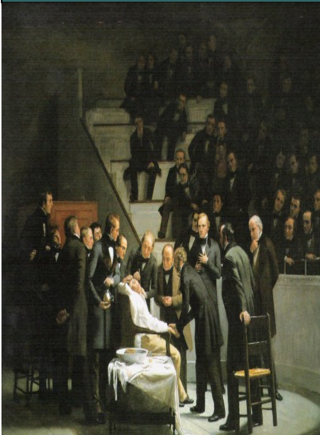
“Anestesia” de Robert Hinckley, 1882