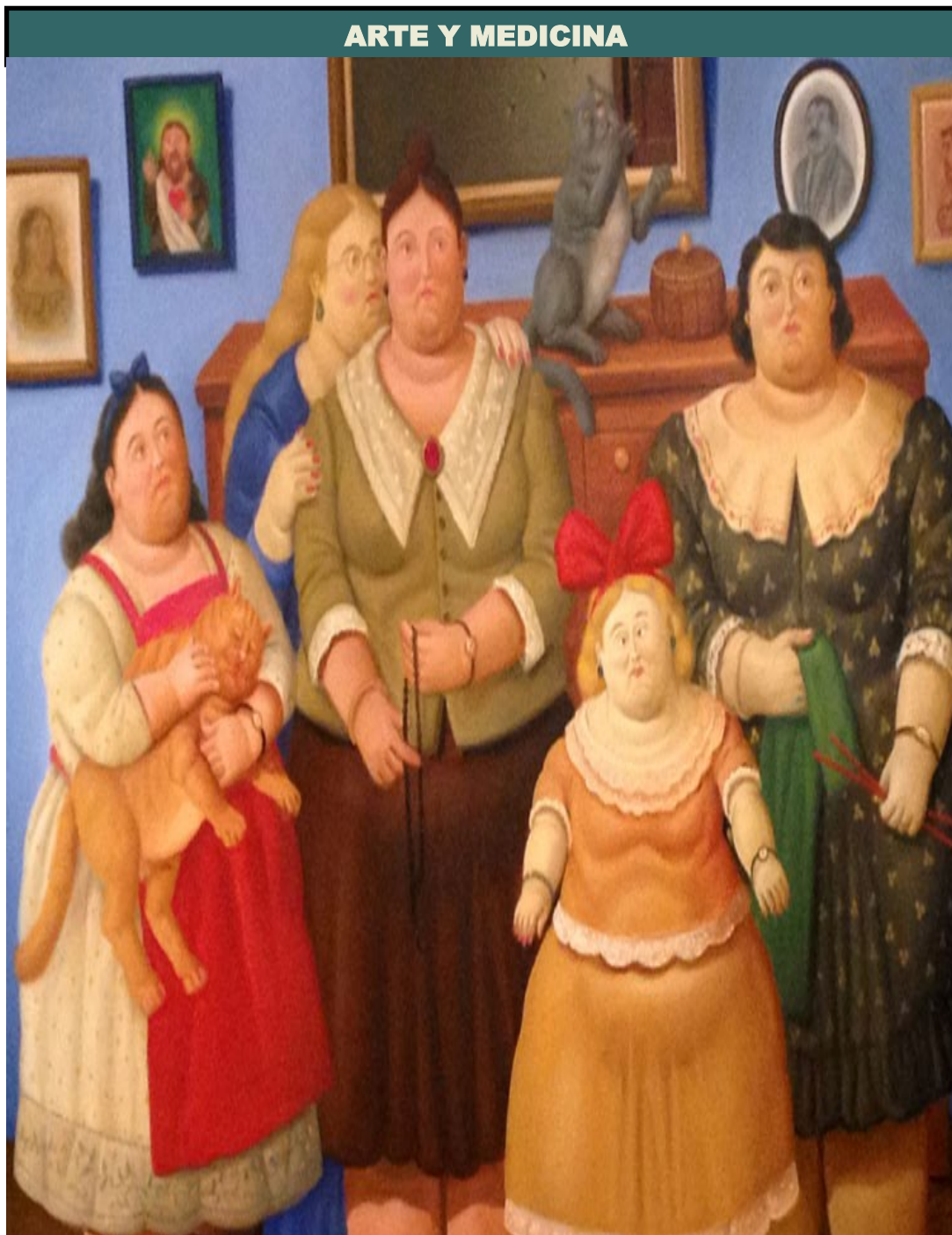
La Familia . Fernando Botero