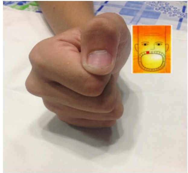
Figura # 1: En esta figura se representa el pulgar de la mano derecha, y el esquema de la cara neonatal

Como puede ver en esta diapositiva le proponemos algunos detalles anatómicos que usted encontrará en el holograma de la cara neonatal, este sistema no es usado con frecuencia en la especialidad nuestra que es Ortopedia y Traumatología pero por ser un sistema holográfico lo damos a conocer, es muy útil en las algias dentarias (Figura # 2)