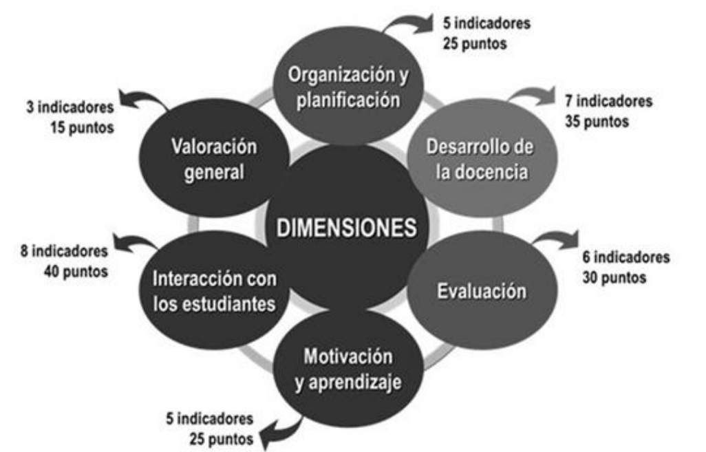
Fig. 2: Dimensiones e indicadores del cuestionario de satisfacción de los estudiantes