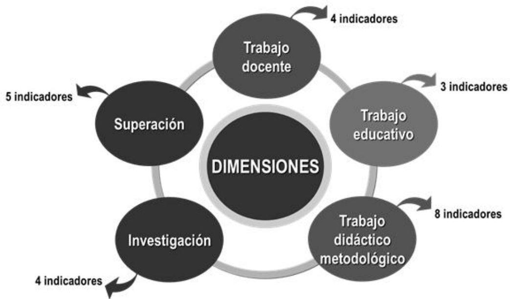
Fig. 3: Dimensiones e indicadores de la guía para la elaboración del informe de autoevaluación del profesor