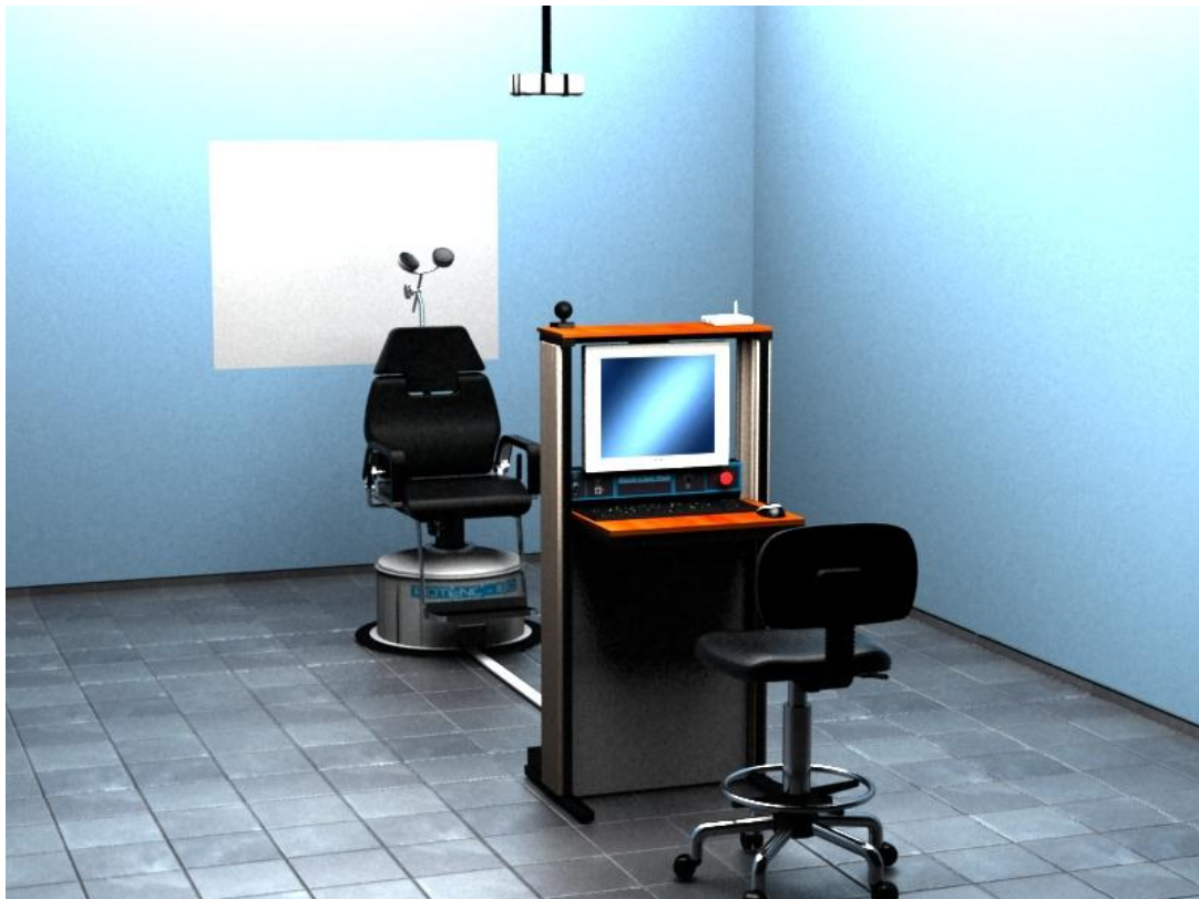
Figura 2. Representación 3D del sistema

El sistema combina las tecnologías digitales y de comunicaciones que permiten su conexión a una red telemática, el registro de datos clínicos y su utilización en otros espacios del asistencial médico. Desde el punto de vista tecnológico el equipo también incluye otra gama de tecnologías que incluye la mecánica la electrónica y la informática pasando por las tecnologías de materiales. La arquitectura del sistema se muestra en la foto procesada de la figura 2.