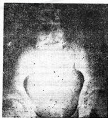
Figuras 2 y 3. Se observa una buena eliminación renal bilateral. Los sistemas pielocaliciales y los uréteres están dilatados bilateralmente, al igual que la vejiga.

pesando al paciente en forma horaria hasta la suspensión de la prueba que duró 4 horas, momento en el cual el paciente había perdido más del 5% de su peso basal, presentando además hemoconcentración y aumento del cloro y sodio plasmático. Durante estas 4 horas el paciente tuvo una diuresis de 2 800 ml y una densidad promedio de 1 002, acompañándose todo esto de astenia marcada y de discreta cefalea.