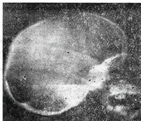
Figura 3. Cráneo mixedematoso: suturas y fontanelas, silla turca redondeada, densidad aumentada de la base. Edad cronológica: 6-2/12 años.

Las lesiones del cráneo se presentaron en 20 pacientes y aparecieron con mayor frecuencia las suturas y fontanelas abiertas, alteraciones de la silla turca y ausencia de senos craneales (figura 3).