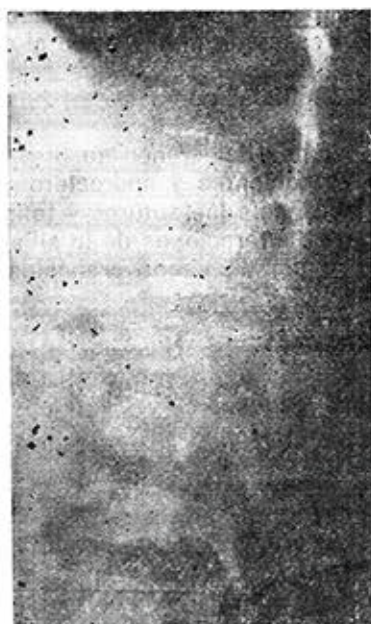
Figura 4. Signos de inmadurez en columna vertebral, surco vascular y doble contorno vertebral, edad cronológica: 8.6/12.

Las lesiones al nivel vertebral fueron observadas en 15 pacientes, predominaron la persistencia de la hendidura del borde anterior del cuerpo vertebral (surco vascular) y doble contorno vertebral (figura 4).