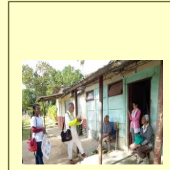
Promoción de salud, casa a casa, en la comunidad El Guayabal. Con participación multidisciplinaria.

Se invita a estudiantes, profesores y a todos los profesionales y trabajadores a participar en la Convención Internacional “Salud para Todos” y al I Congreso Nacional Una Salud. A celebrarse del 21 al 25 de abril del 2025.