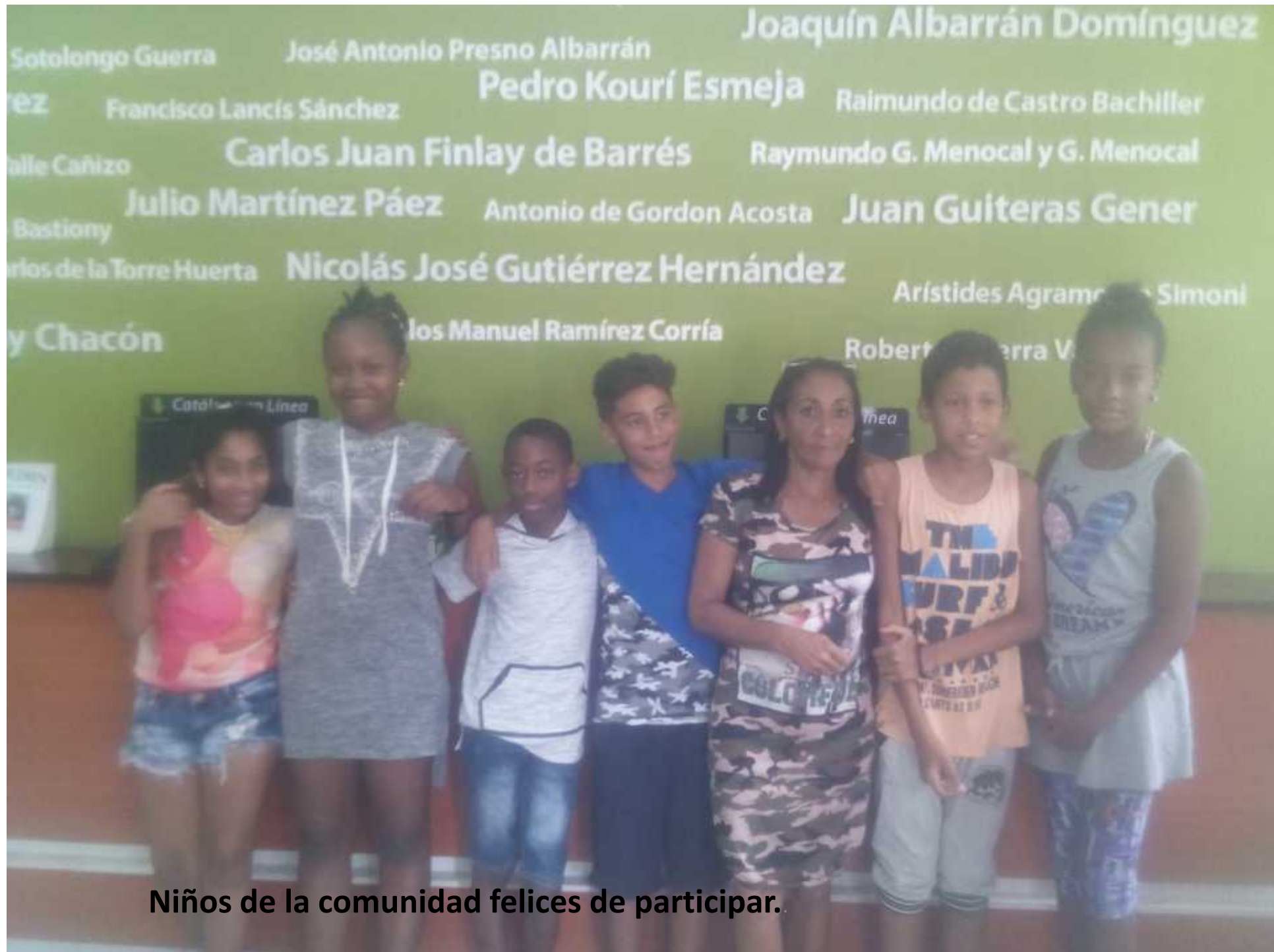
Niños de la comunidad felices de participar.