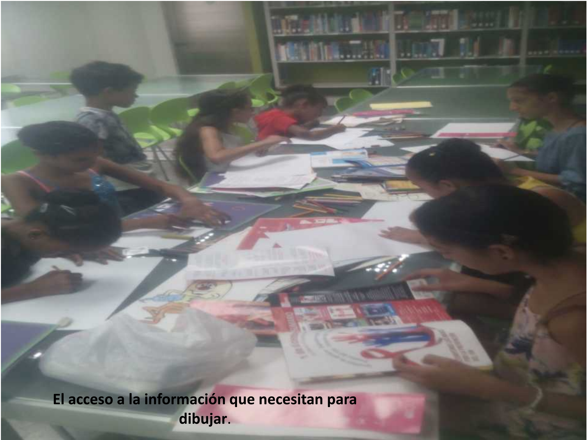
El acceso a la información que necesitan para dibujar.