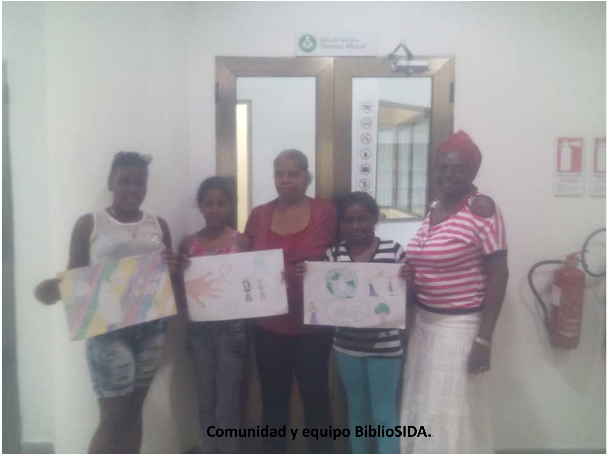
Comunidad y equipo BiblioSIDA.