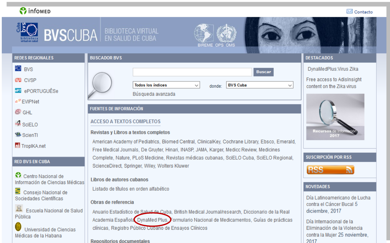
Fig. 1. Portal Biblioteca Virtual en Salud de Cuba . Entrada al recurso DynaMed Plus

En el Portal Biblioteca Virtual de Salud (BVS): Usted puede acceder a la base de datos DynaMed Plus donde encontramos temas en evidencia clínica