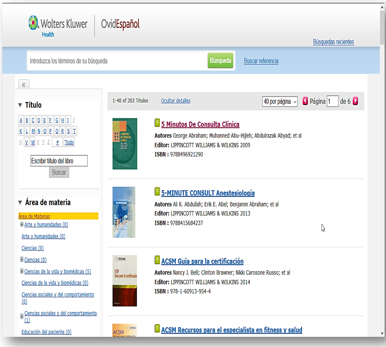
Fig 1. Sitio Web Ovid Español

La combinación de la tecnología de búsqueda flexible y las herramientas de productividad de investigación ofrece flexibilidad, rapidez y eficacia para que los usuarios puedan encontrar lo que buscan.