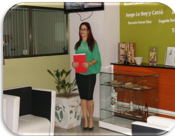
Montaje y presentación de la exposición