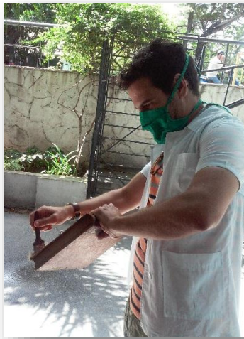
Limpieza del material a exponer

Los documentos se revisan para determinar su estado de conservación y no corra riesgo la integridad de la obra, ya sea los materiales propios de la biblioteca o los que hayan sido prestados por otra institución, en ambos casos se procede de igual forma. Si es necesario se realiza tratamiento de limpieza; recientemente en el montaje de la exposición presentada en el mes de mayo sobre Carlos J. Finlay, el material documental expuesto nos fue facilitado por cortesía de la Academia de Ciencias de Cuba. Parte de este material presentaba indicadores de alteración como: suciedad, roturas, foxing, galerías. El personal de conservación realizó una limpieza técnica de dichos documentos y la especialista determinó cuáles de ellos serían expuestos.