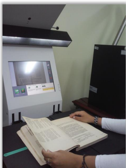
Digitalización de Documentos

Este proyecto permitirá diseminar el patrimonio científico de una manera más eficiente ya que los usuarios podrán acceder a los documentos digitalizados a través de la base de datos bibliográfica cubana CUMED, de la Biblioteca Virtual de Salud (BVS) del portal de Infomed.