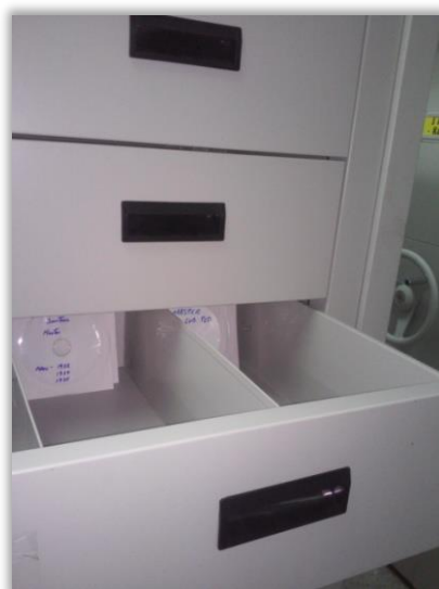
Almacenamiento de los soportes digitales