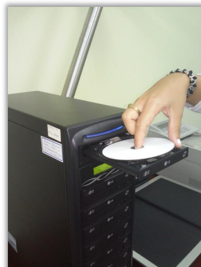
Copia de los Máster de Preservación